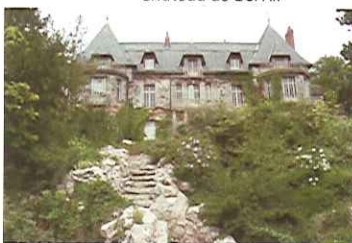
Château de Bel Air

Longer les bois puis les traverser 3 et enfin par une allée ombragée surplombant la vallée de Gâtacier B gagner Bordebure 4. Une bonne descente à travers bois dans la vallée 5 pour retrouver le centre bourg par la rue des Noël's, l'allée de Candy, la rue Henri Oudin qui longe la mairie.