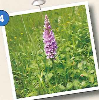
Orchis de Fuchs