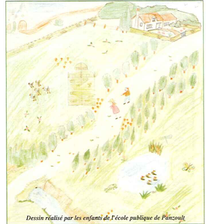
Dessin réalisé par les enfants de l'école publique de Panzoult

Son site touristique, ses vins de Chinon