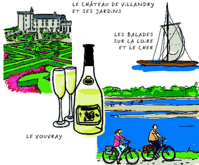
LE CHÂTEAU DE VILLANDRY ET SES JARDINS