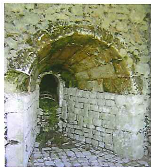
Four à chaux - Propriété privée

Traverser Couteau pour se diriger vers la Lande. Un peu avant ce village prendre à gauche au coin du bois 5 et suivre le petit chemin étroit qu'il faudra quitter par la gauche avant le ruisseau 6 . Sortir du bois et suivre jusqu'aux Briants, longer le lavoir du haut du pont D pour arriver aux Girardières.