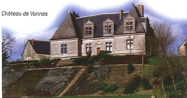
Château de Vannes

A la ferme des Erables 2, suivre la route goudronnée, tourner à gauche avant le pont enjambant le ruisseau et dans les bois prendre à gauche le premier chemin qui monte et rejoint le grand circuit au Pérouzet 6.